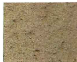
Terre beige (T 70)