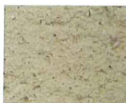
Terre de sable (T 50)