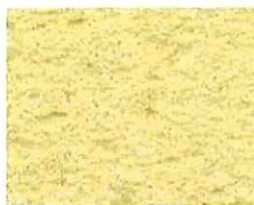
Jaune paille (J 50)