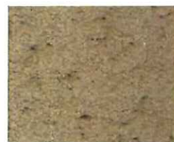
Terre beige (T 70)