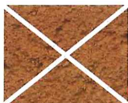
Brique naturelle (O 90)