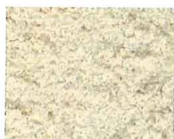
Sable rosé (R 20)