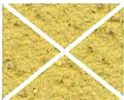
Jaune pollen (J 60)