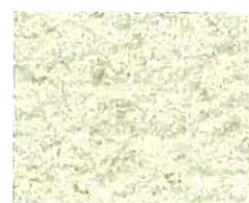
Blanc cassé (G 20)