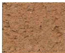
Brique rose (R 70)