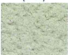
Pierre (V 10)