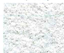
Naturel (G 00)