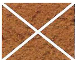
Brique naturelle (O 90)