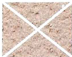
Rose soutenu (R 60)