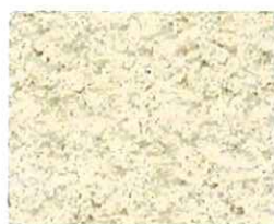
Sable clair (T 20)