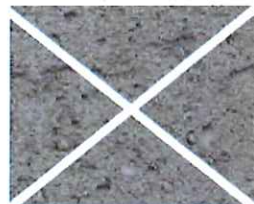
Gris fumé (G 40)