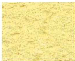
Jaune paille (J 50)