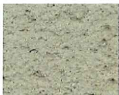
Terre feutrée (T 60)