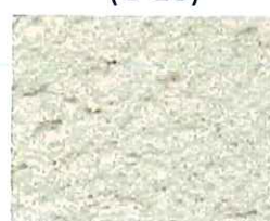
Sable orange (T 40)