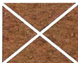
Terre de Sienne (R 80)