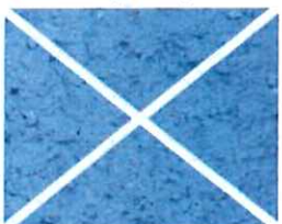
Bleu azur (B 30)