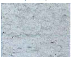
Gris souris (G 30)