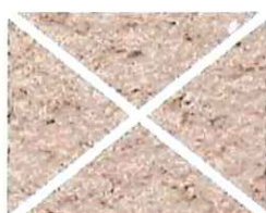
Rose soutenu (R 60)