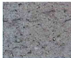
Gris fumé (G 40)