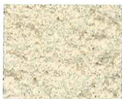
Sable rosé (R 20)