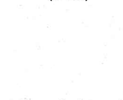
Blanc du littoral (BL 10)