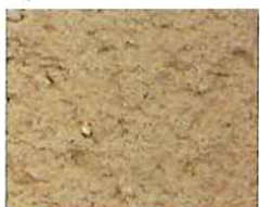
Rose orange (O 60)