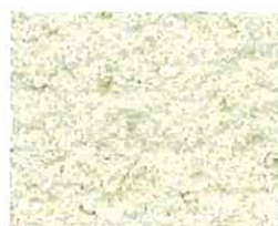
Blanc cassé (G 20)