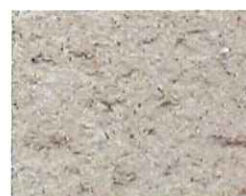
Rose parme (R 30)