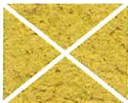
Jaune Ocre (J 70)