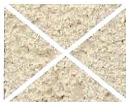
Beige rosé (O 50)