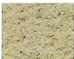
Beige (T 80)