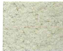
Beige orange (O 30)