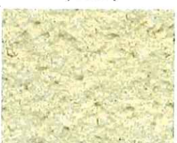
Jaune paille (J 20)