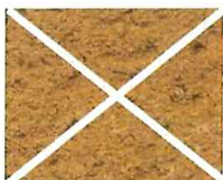
Terre orange (O 80)