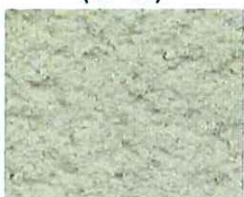
Pierre (V 10)