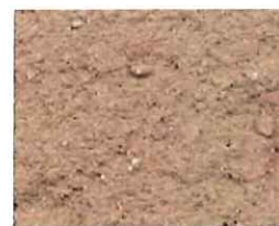
Vieux rose (R 50)