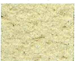
Sable jaune (J 40)