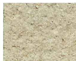
Terre rosée (T 90)