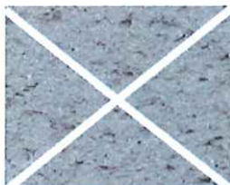
Gris cendre (G 50)