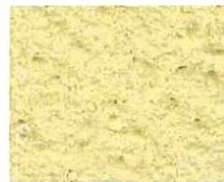
Opale (J 30)