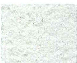
Blanc lumière (G 10)