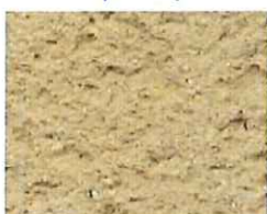
Pétale rose (R 40)