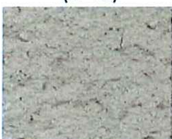
Grège (T 10)