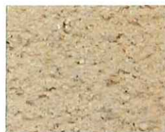
Nacre orange (O 20)