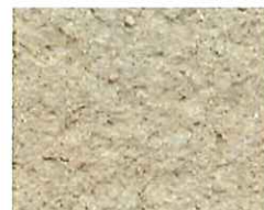
Terre rosée (T 90)