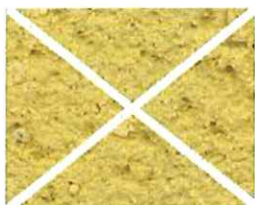
Jaune pollen (J 60)