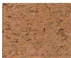
Brique rose (R 70)