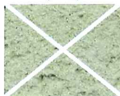
Vert pâle (V 30)