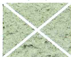
Vert pâle (V 30)