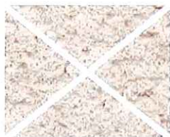
Rose nacré (R 10)