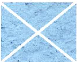
Bleu ciel (B 20)