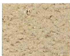
Nacre orange (O 20)