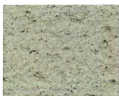
Terre feutrée (T 60)