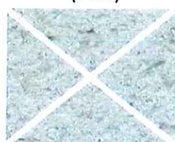
Vert astral (V20)