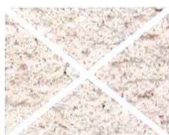
Rose nacré (R 10)