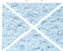
Terre de lune (B 10)