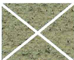
Terre d'argile (T 30)