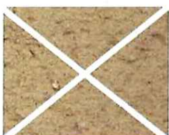
Rose orange (O 60)