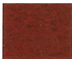
Brique rouge (R 90)