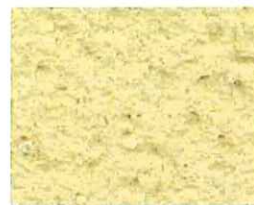
Opale (J 30)