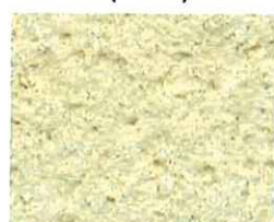
Jaune paille (J 20)