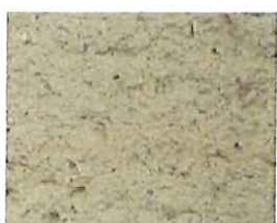
Terre de sable (T 50)