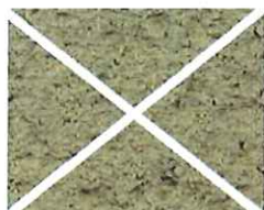
Terre d'argile (T 30)