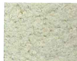
Beige orange (O 30)