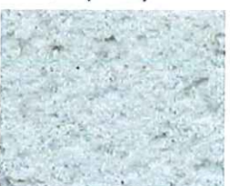
Vert astral (V20)