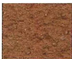
Terre de Sienne (R 80)