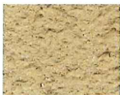
Pétale rose (R 40)