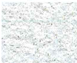
Naturel (G 00)