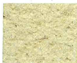
Sable jaune (J 40)