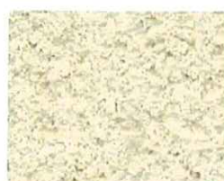
Sable clair (T 20)