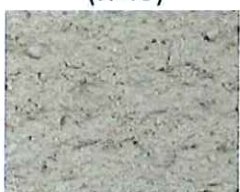
Grège (T 10)