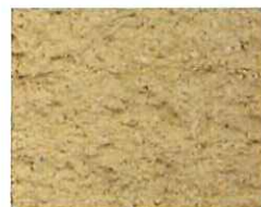
Jaune orange (J 10)