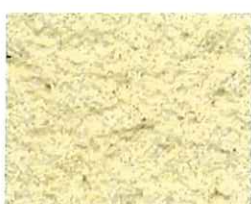
Sable d'Athènes (J 39)