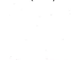
Blanc du littoral (BL 10)