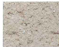
Rose parme (R 30)