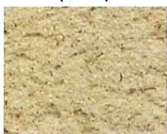
Beige rose pâle (O 40)