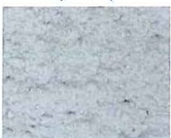
Gris souris (G 30)