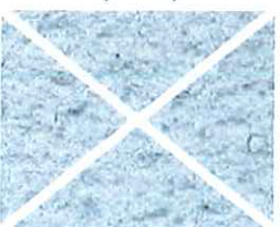
Terre de lune (B 10)