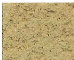
Ocre clair (O 70)