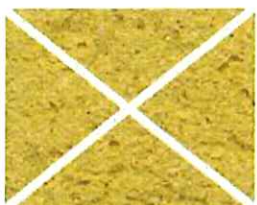
Jaune Ocre (J 70)