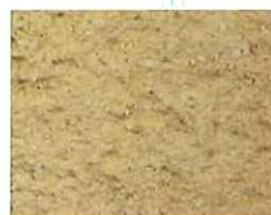
Jaune orange (J 10)