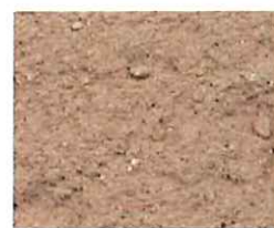
Vieux rose (R 50)