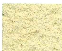
Sable d'Athènes (J 39)