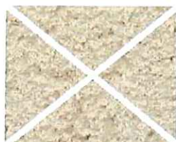
Beige rosé (O 50)