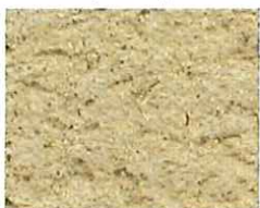
Beige rose pâle (O 40)