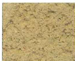
Ocre clair (O 70)