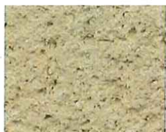
Beige (T 80)