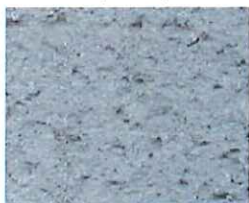
Gris cendre (G 50)