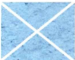
Bleu ciel (B 20)