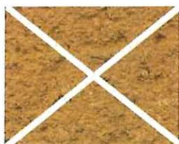
Terre orange (O 80)