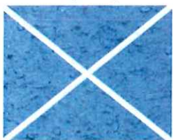
Bleu azur (B 30)