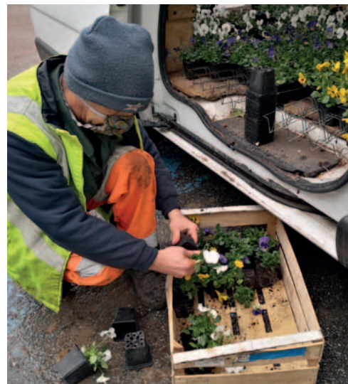
Les services des espaces verts fleurissent le centre-ville.