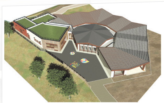
Le projet de la future École des Ayencins.