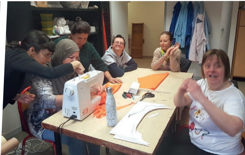
Atelier création de costumes pour le carnaval.

de femme du SEJ et un groupe adulte du secteur de jour de l'AFIPH (St Maurice l'Exil) pour le Carnaval du Péage